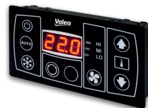
Control Unit SC 400 / SC 410

Funktional, robust und einfach in der Bedienung